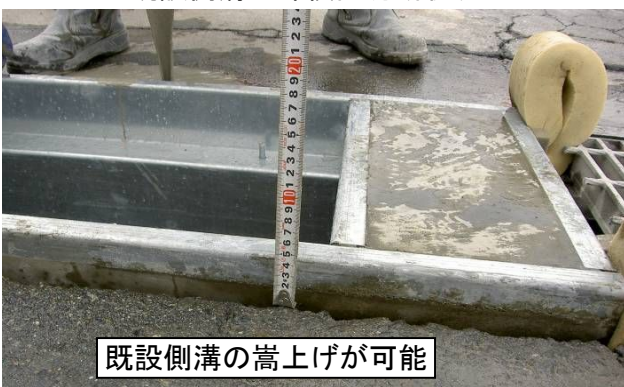
側溝上部補強スラブ高さ調整(嵩上げ)