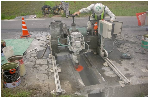
既設側溝上部横断面切断状況