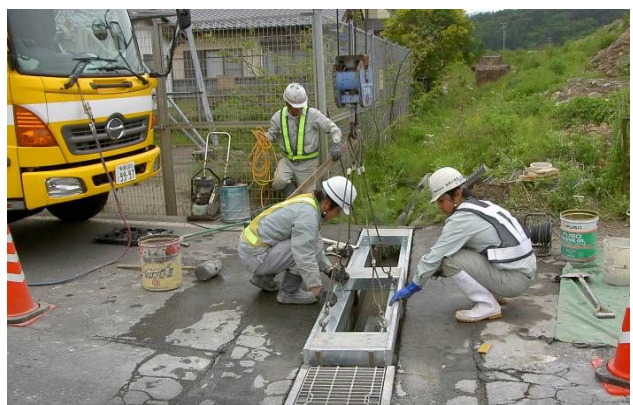
側溝上部補強スラブ設置状況