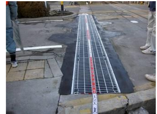
固定式グレーチング設置および すり付け特殊弾性舗装完了