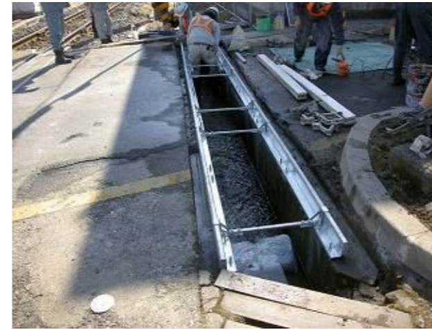
側溝上部補強金具設置