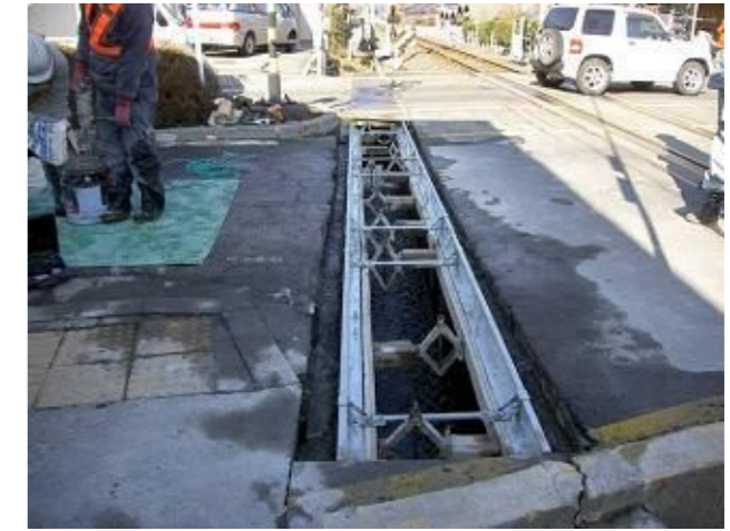
側溝上部補強金具設置 (調整間詰めコンクリート打設前)