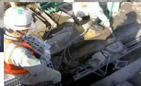
コントローラによる操作状況