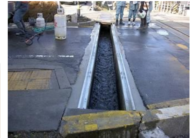
調整間詰めコンクリート打設完了 (速硬化無収縮モルタル)