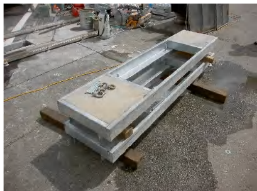
側溝上部補強金具(横断タイプ300型)