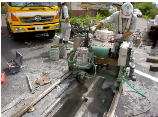
側壁切断状況(サイドカッティングマシン使用)