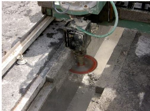
側壁切断状況(サイドカッティングマシン使用)