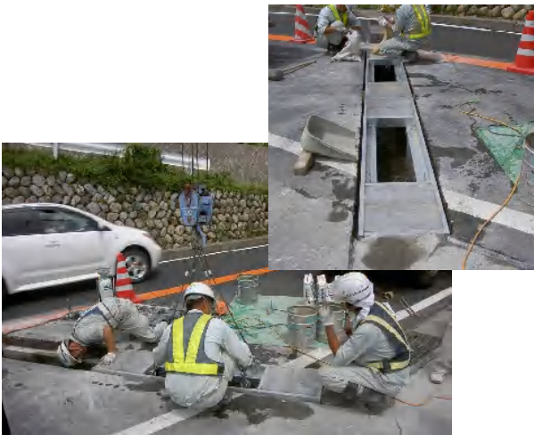
側溝上部補強金具(横断タイプ)据付